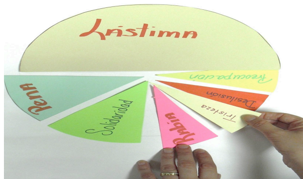
Figura 1. Ejercicio Las dificultades del sentir

Sesión 3- Interacción médico-paciente ante el estigma. Los objetivos de esta sesión fueron: 1) reflexionar en relación al rol de el/la profesional como fuente de estigma social en la interacción médico-paciente, 2) reflexionar en relación al contexto social que fomenta el estigma hacia el VIH/SIDA en Puerto Rico, 3) conocer cómo la posición de poder de profesional de medicina puede fomentar manifestaciones de estigma y 4) desarrollar destrezas para la interacción no-estigmatizante. El formato que utilizamos para discutir el tema fue presentación titulada “ Interacción médico-paciente ” cuyos objetivos para las personas participantes fueron: a) aplicar el concepto de estigma en situaciones clínicas (por ejemplo, cómo eventos estigmatizantes impactan adherencia al tratamiento) y b) conocer y analizar críticamente el contexto social en Puerto Rico que puede generar estigma hacia el VIH/SIDA. La meta fue discutir eventos estigmatizantes dentro de un contexto clínico, reconocer el contexto social en que se vive con VIH/SIDA en Puerto Rico, formas en que se regula la interacción médico-paciente, el rol de los medios de comunicación y la política pública en la estigmatización del VIH/SIDA. Además, de vital importancia fue el desarrollo de destrezas para la interacción no estigmatizante con PCVS.