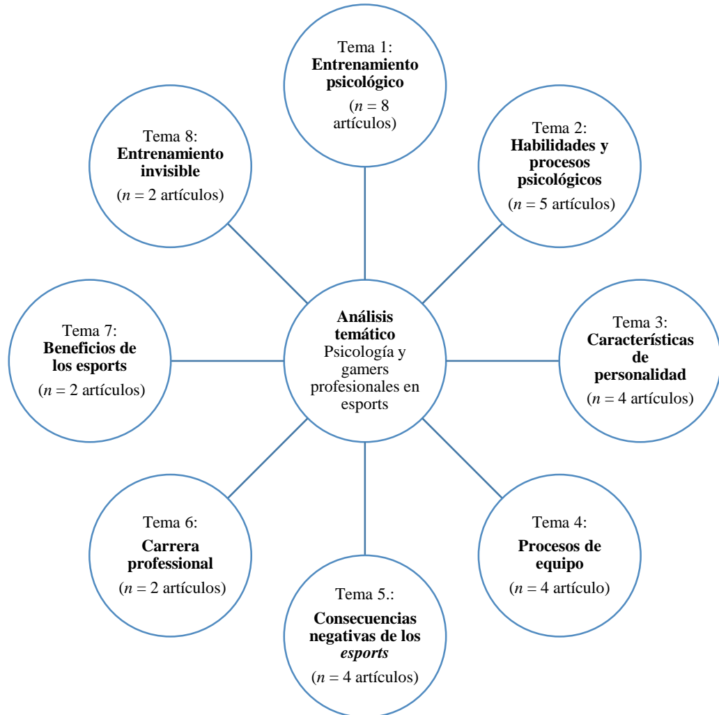
Figura 2. Análisis temático sobre Psicología y gamers profesionales en esports (2012-13 de junio de 2020).

rendimiento del gamer , como, por ejemplo, la alimentación y el descanso (Bonnar et al. , 2019; García & Chamarro, 2018).